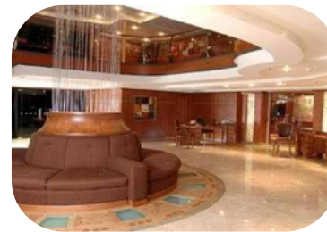
MS Mojito Salidas: Miércoles y Sábado