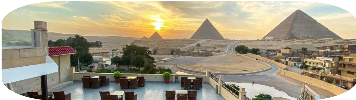
Hotel Stay Inn Pyramids Hotel