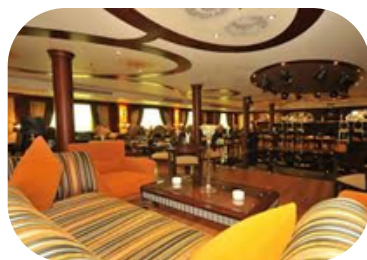
MS Royal Viking Salidas: Lunes y Viernes