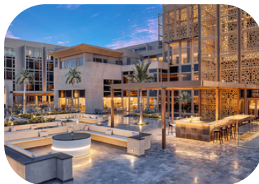
Hyaat Centric Cairo West