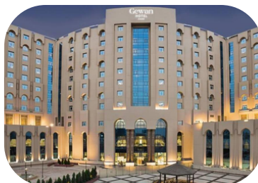
Gewan Hotel Cairo