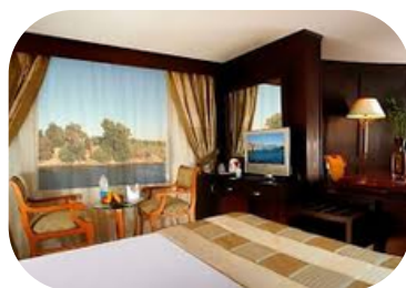
MS Tiyi I Salidas: Lunes y Viernes