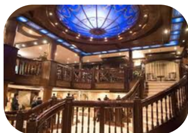
Cadena Sarah Salidas: Lunes y Viernes