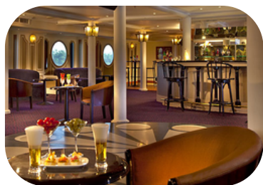
MS Semiramis III Salidas: Lunes y Viernes