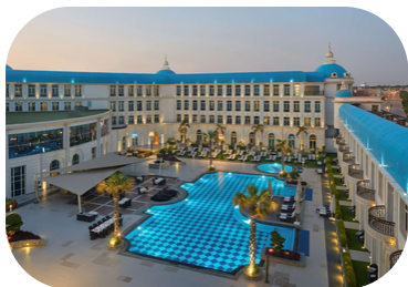
Royal Maxim Palace Kempinski