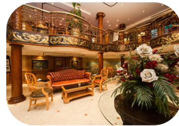
MS Grand Rose Salidas: Miércoles y Sábado