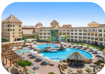
Hotel Hilton Pyramides Golf