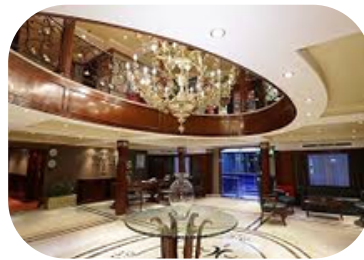
MS Blue Shadow 3 Salidas: Miércoles y Sábado