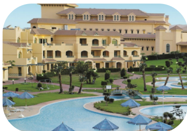
Movenpick Media City