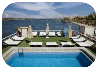
MS Nile Plaza