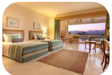
Jolie Ville Golf Beach