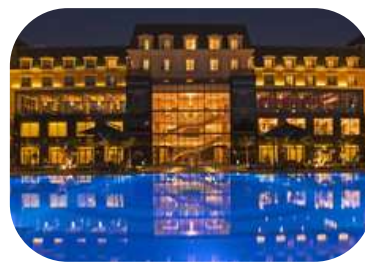
Renaissance Cairo Mirage