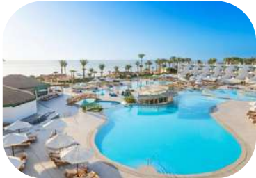
Hotel Safir Waterfalls