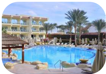
Xperience Sea Breeze