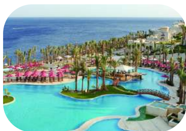
Grand Rotana Sharm