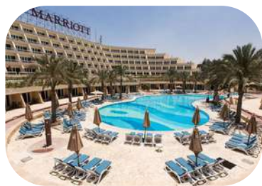
JW Marriott Hotel