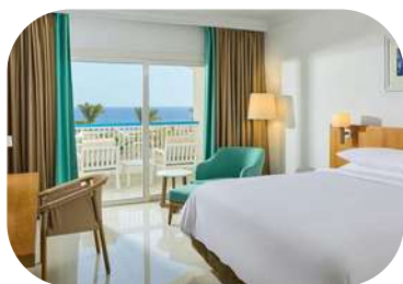
Renaissance Sharm el Sheij