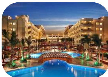
Seti Sharm Palm Beach Resort