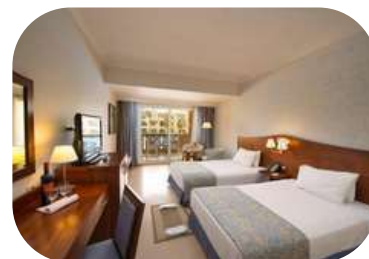
Xperience Kirosez Parkland ★★★★★