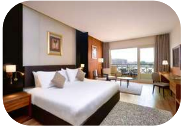
Movenpick Cairo Media City