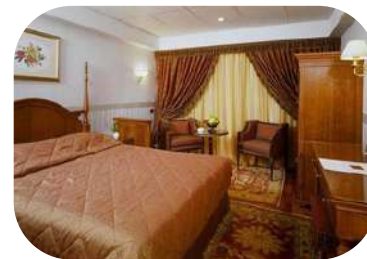
MS Royal Princess